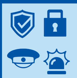
Schutz und Sicherheit